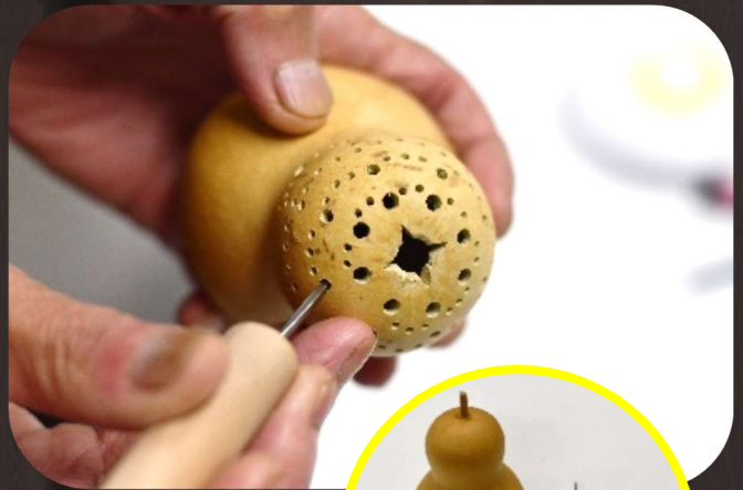
当日使用するキット (ひょうたんのサイズは約15cm)

コツはよりたくさん穴をあけること。楽しく簡単にできるので、みんなで一緒に素敵なひょうたんランプを作りましょう。